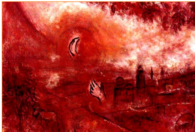
Marc Chagall - Le Cantique des Cantiques

Que notre création de l'Obscur à la Lumière , pour cette 3 ème édition de Verbe Sacré , répercute les voix de Salomon, de Jean de la Croix et de Rilke. Qu'elle soit fanal et, du bord de l'Océan, attise chacun en ce qu'il est, le guidant vers un Port d'espérance. Que de la terre au ciel, de l'Espagne du 15 ème à ce monde du 21 ème siècle et sur une terre qui est en feu comme la voyait déjà la Sainte d'Avila, surgisse un souffle serein, ineffable et qui, caressant les ruines de l'ancienne abbaye, glissera jusqu'à l'intime de chaque spectateur.