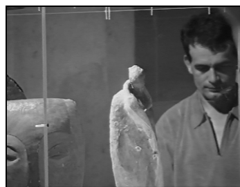
Nuit Dantesque – Festival Colla Voce – Poitiers