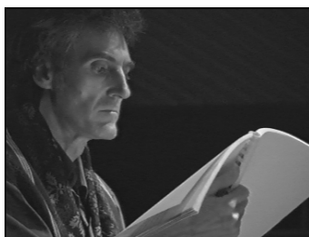
Nuit Dantesque - Festival Colla Voce - Poitiers