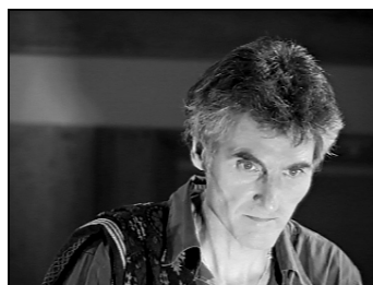
Nuit Dantesque - Festival Colla Voce - Poitiers